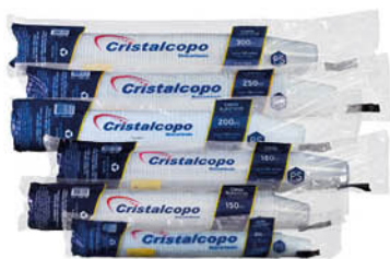
Embalagens com 100 unidades