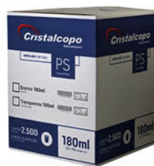
Caixa de Transporte Mais resistente para o armazenamento