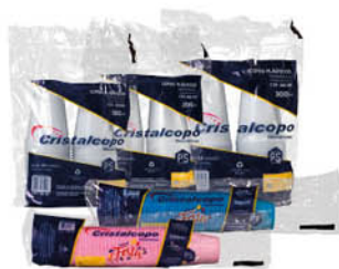
Embalagens com 50 unidades